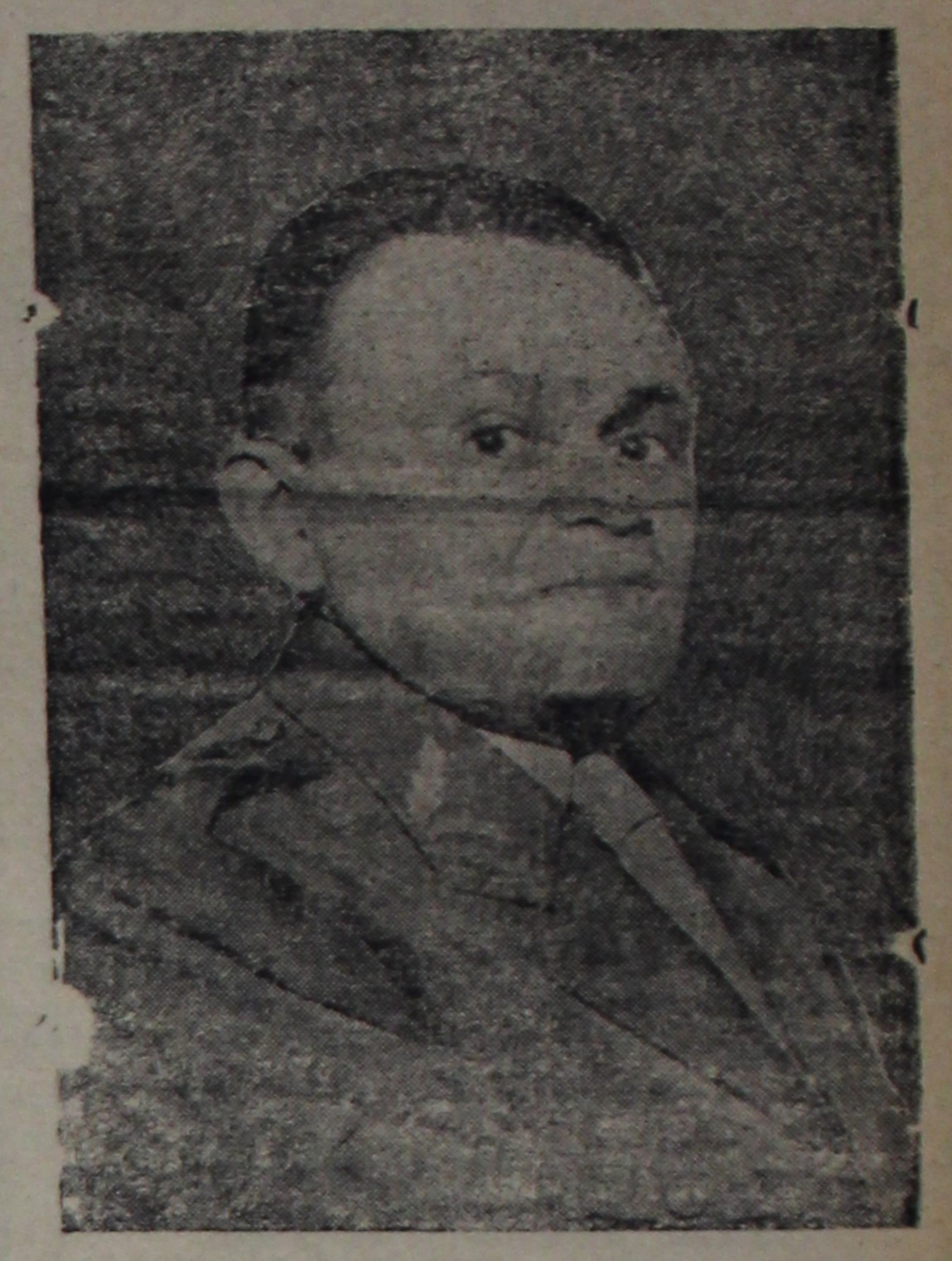
BRASILIA, 8 — O Palácio do Planalto confirmou que o Presidente Castelo Branco fará importante discurso na próxima quinta-feira, em Niterói, onde irá receber o título de Cidadão Fluminense que lhe foi concedido pela Assembléa Legislativa do Estado do Rio. O Presidente na ocasião abordará a política administrativa do governo, fazendo um balanço das atividades desenvolvidas até agora.

RIO, 8 — O Ministro da Guerra resolveu aceitar o convite do governo português para visitar o país. O Gen. Costa e Silva seguirá dia 25. Fonte do Ministério da Guerra informou que o Ministro poderá es-